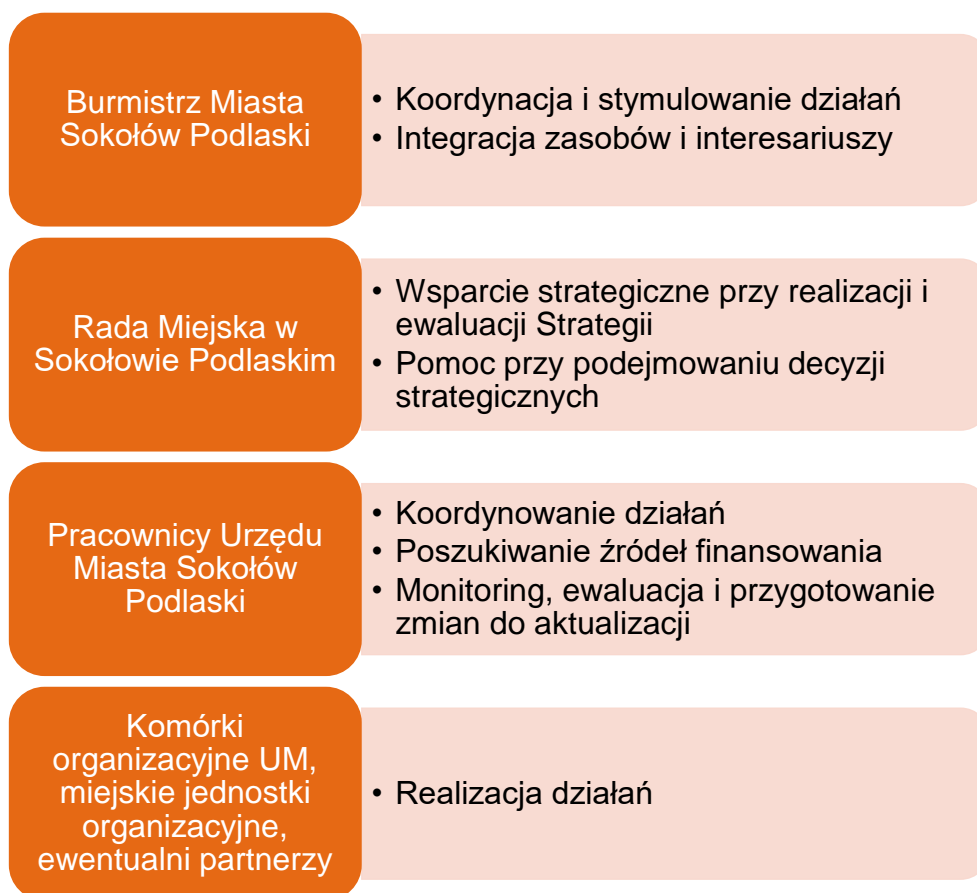
Rysunek 2. Podział zadań realizacji Strategii